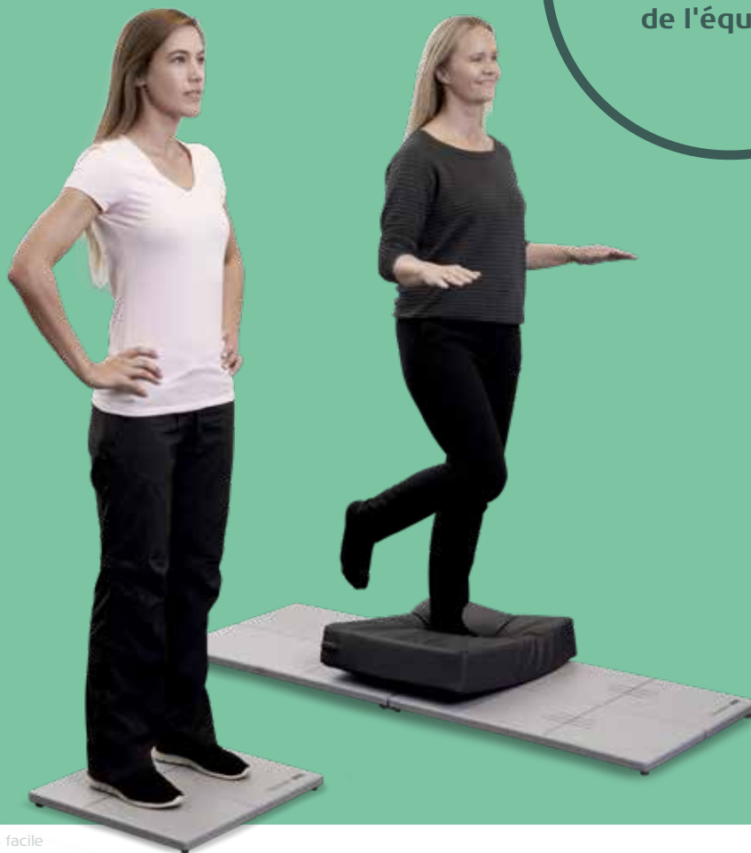
Balance Quest by Interacoustics

Outils efficaces pour l'évaluation et la rééducation de l'équilibre