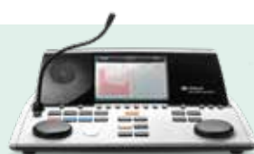
AD629 Audiomètre de diagnostic