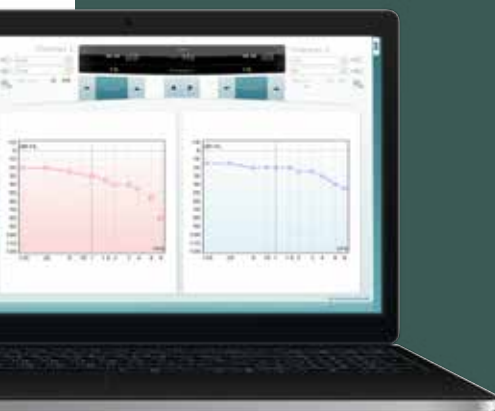
Software Diagnostic Suite (sólo AS608e)