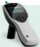
MT10 Timpanometro de mano