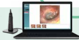
Viot™ Video Otoskop