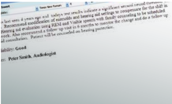
Bericht-Ansicht der Diagnostik Suite (nur AS608e)